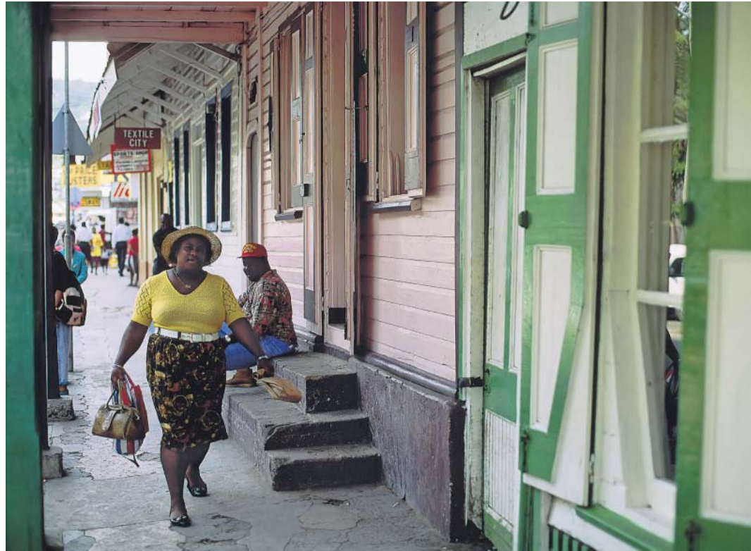
Alles rund: Auf St. Lucia vergeht die Zeit objektiv betrachtet auch nicht langsamer als anderswo – aber sie fühlt sich besser an.