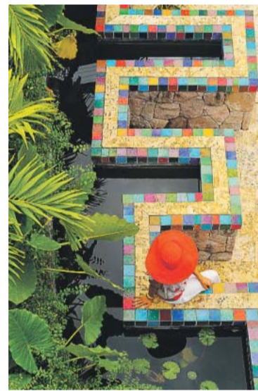
Hotel „Jade Mountain“ mit Hut h.o.

„Jade Mountain“ (Telefon 0 01/75 84 59 40 00, www.jademountain.com ) – Ausblick und Luxus atemberaubend, ein Hotel für Lottogewinner und Menschen, die nur einmal im Leben heiraten wollen. Ein Doppelzimmer beginnt bei 803 Euro pro Nacht.