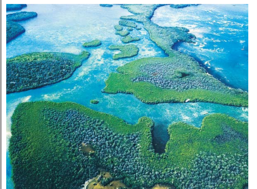
Von oben sieht der Segler die Geheimnisse der Karibik: Ankerplätze!

Polyglott, Apa Style: „Karibik – Kleine Antillen“, 362 Seiten, 24,95 Euro