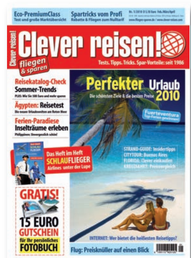
Beilage in „Clever reisen“, Gesamtauflage/ supplement in print run „Clever reisen“: