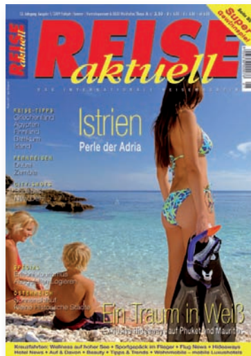
Beilage in „REISE aktuell“, Abo-Auflage und Bordexemplare/ supplement in subscription print run and airline copies „REISE aktuell“: